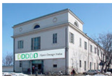
Foro Boario in Modena